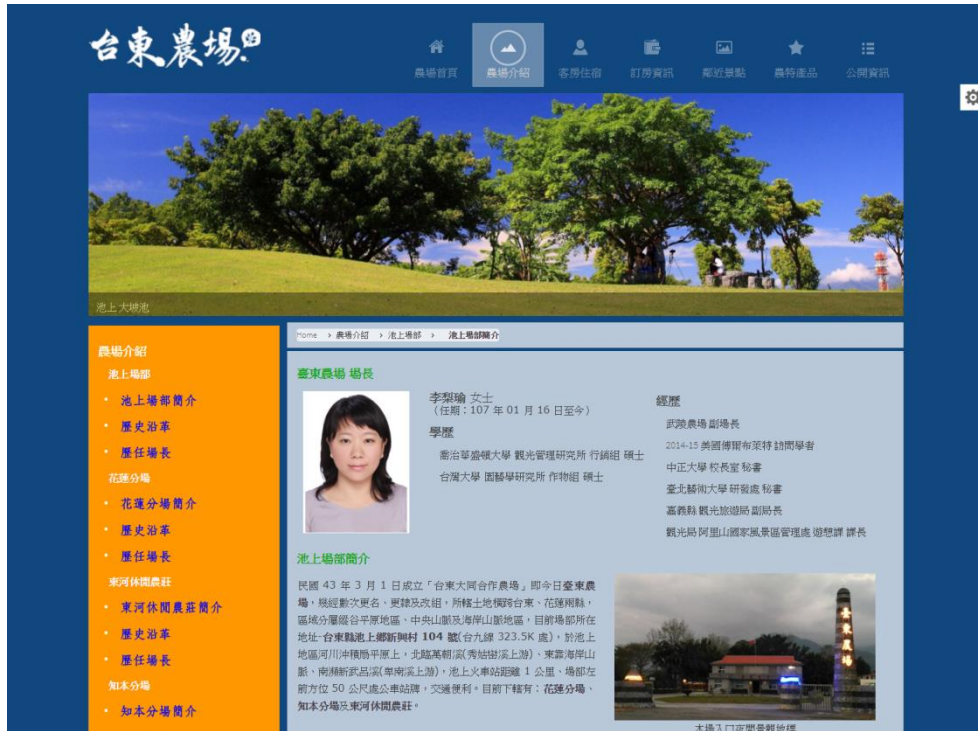
圖 9. 池上場部簡介新增農場場長介紹