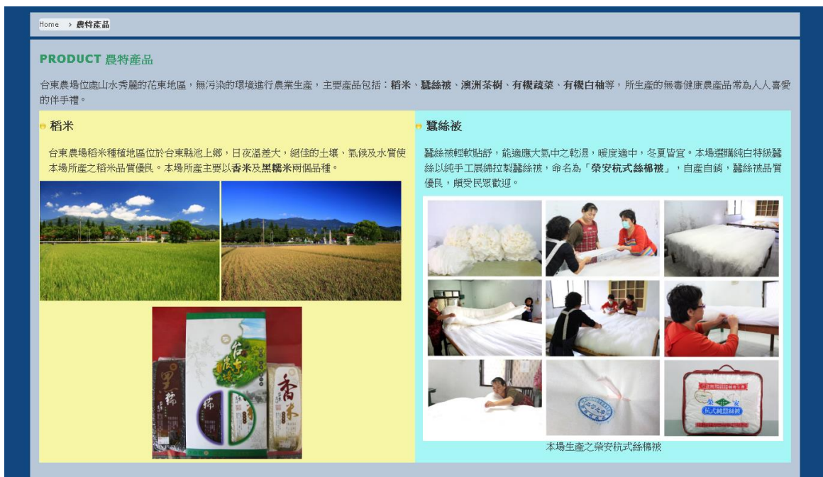
圖 16. 台東農場-農特產品-移除價目表及其目錄