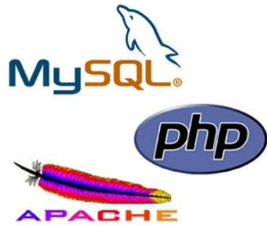
圖 2. WAMP Server Logo

W - Windows A - Apache M - MySql P - Php WAMP - Server