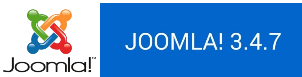
圖 1. Joomla! Logo 及版本編號