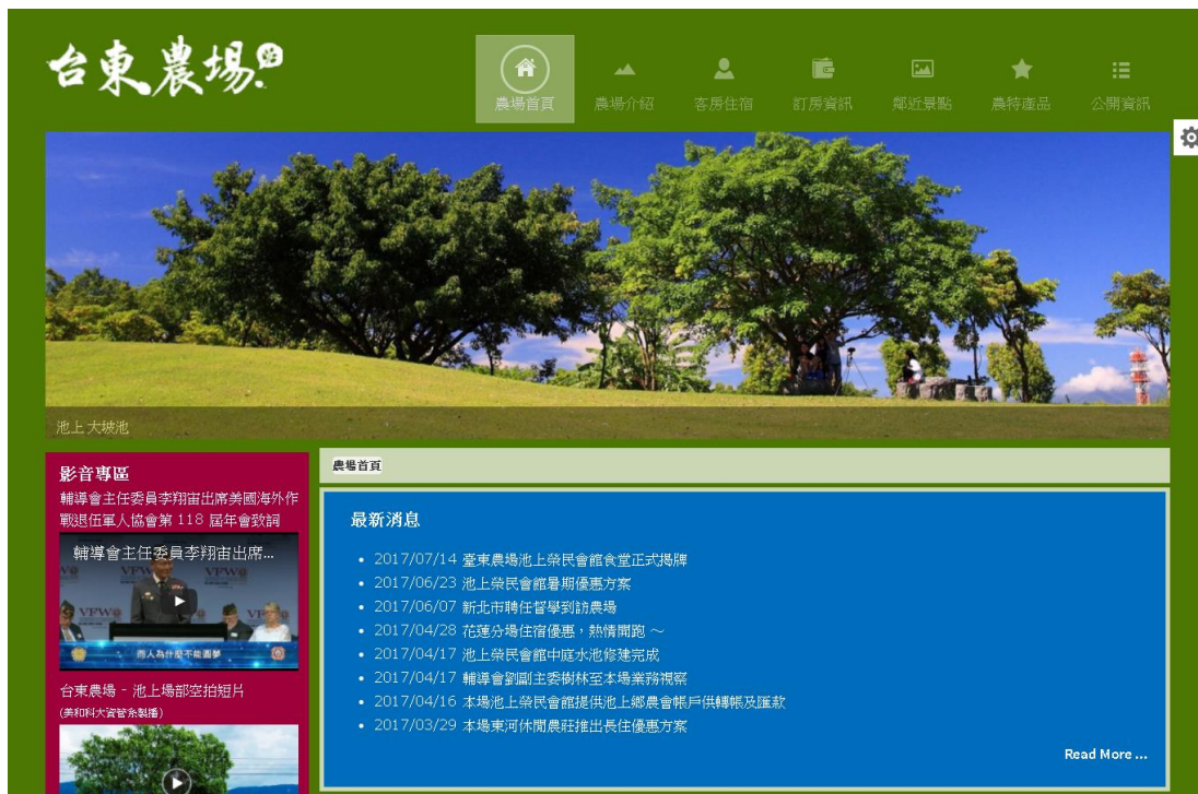
圖 6. 版面背景顏色 - Green