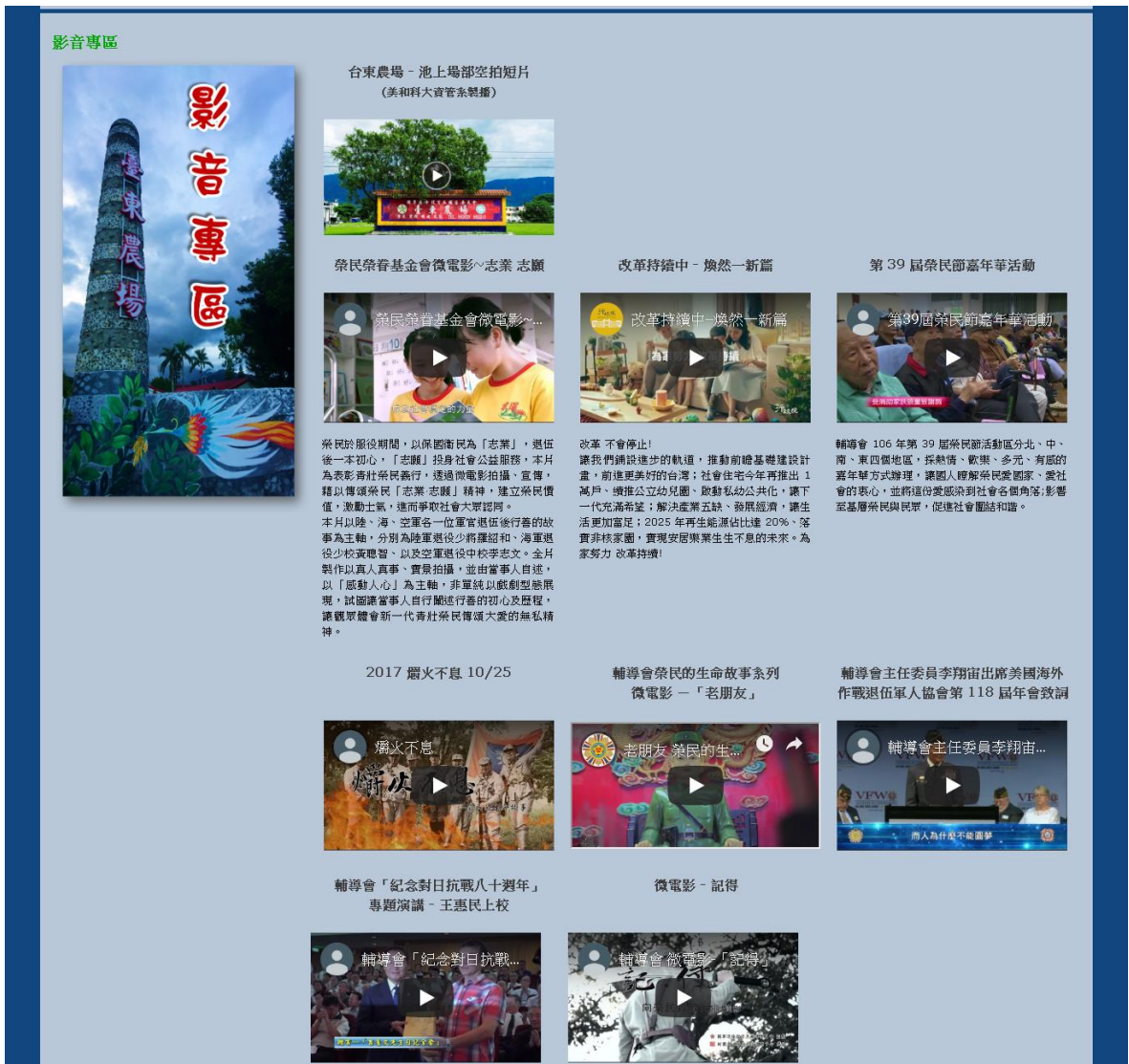
圖 19. 台東農場-影音專區新增輔導會祭民榮眷基金會微電影-志業 志願 資訊