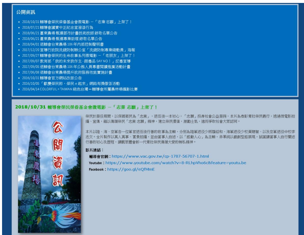
圖 18. 台東農場-公開資訊新增輔導會榮民榮眷基金會微電影-志業 志願 資訊

(10) 107/10/31 台東農場-公開資訊、影音專區新增輔導會榮民榮眷基金會微電影-志業 志願資訊(如圖 18、19)。