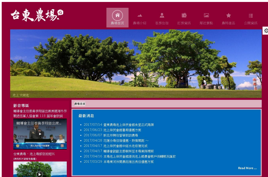
圖 5. 版面背景顏色 - Red