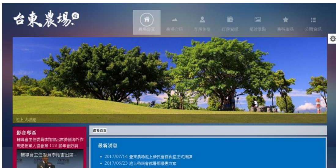
圖 8. 版面背景顏色 - Image

6. 各網頁內容文字色彩及背景色調，依版面風格採一致性版面配置呈現，農場內各種設施、環境、活動等照(影)片，由台東農場提供現有適當之照(影)片，如無適當之照(影)片則由參與本專案之工讀學生赴現場實地重拍攝，及做必要之編修、剪輯處理程序。