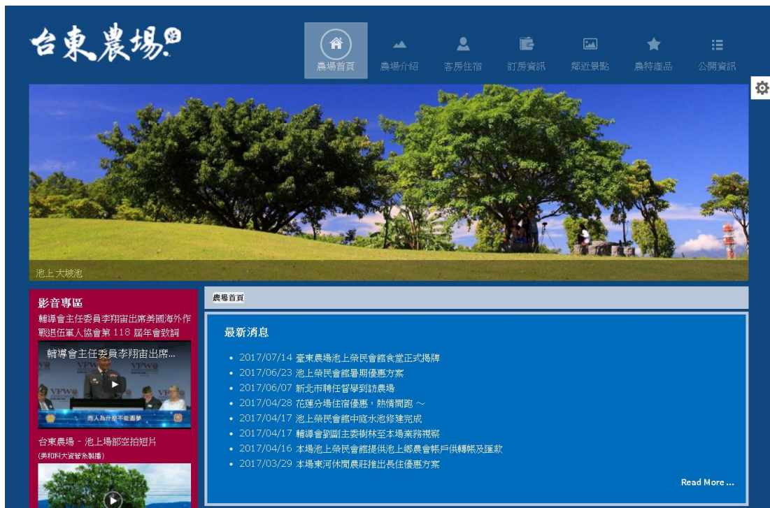
圖 4. 版面背景顏色 – Blue

5. 本專案網站版面以 Joomla! 提供之版面背景顏色供使用者自行選擇呈現，如圖 4, 5, 6, 7, 8 所示。