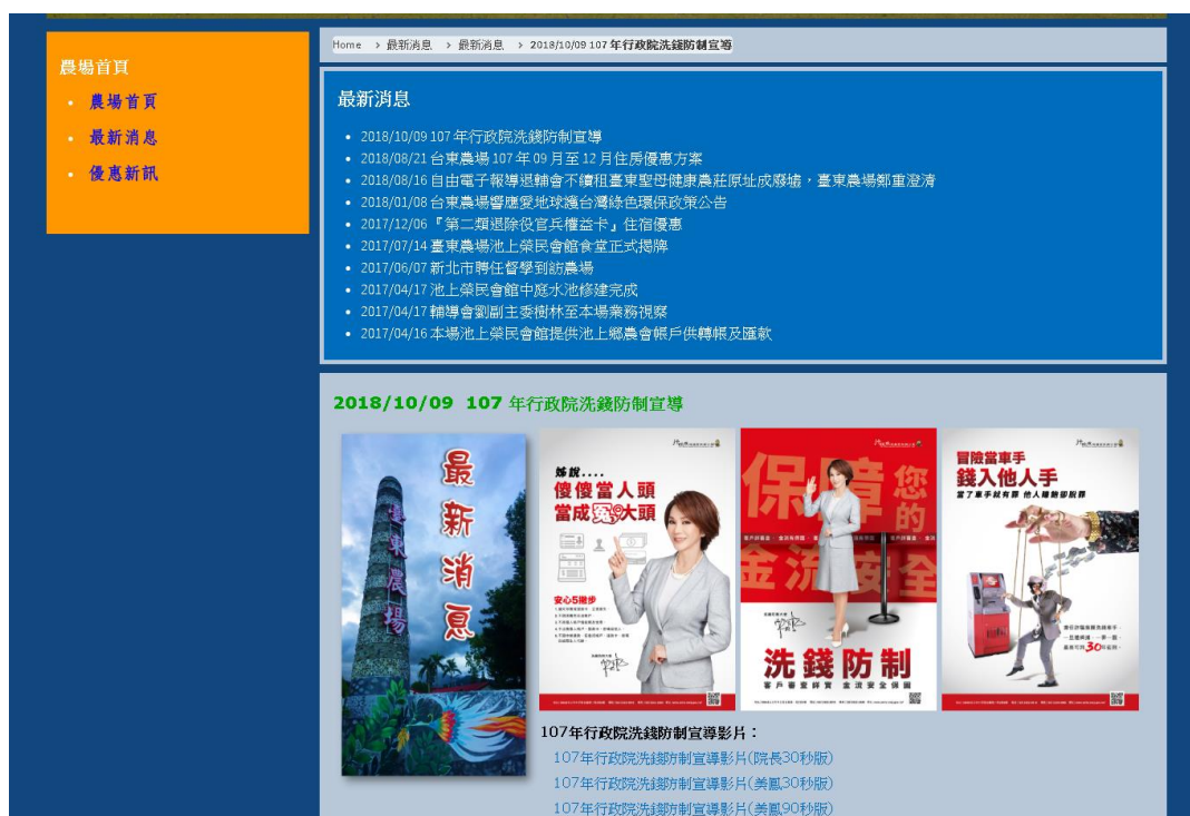
圖 17. 最新消息-新增 107 年行政院洗錢防制宣導海報及影片

(9) 107/10/09 最新消息-新增 107 年行政院洗錢防制宣導海報及影片(如圖 17)。