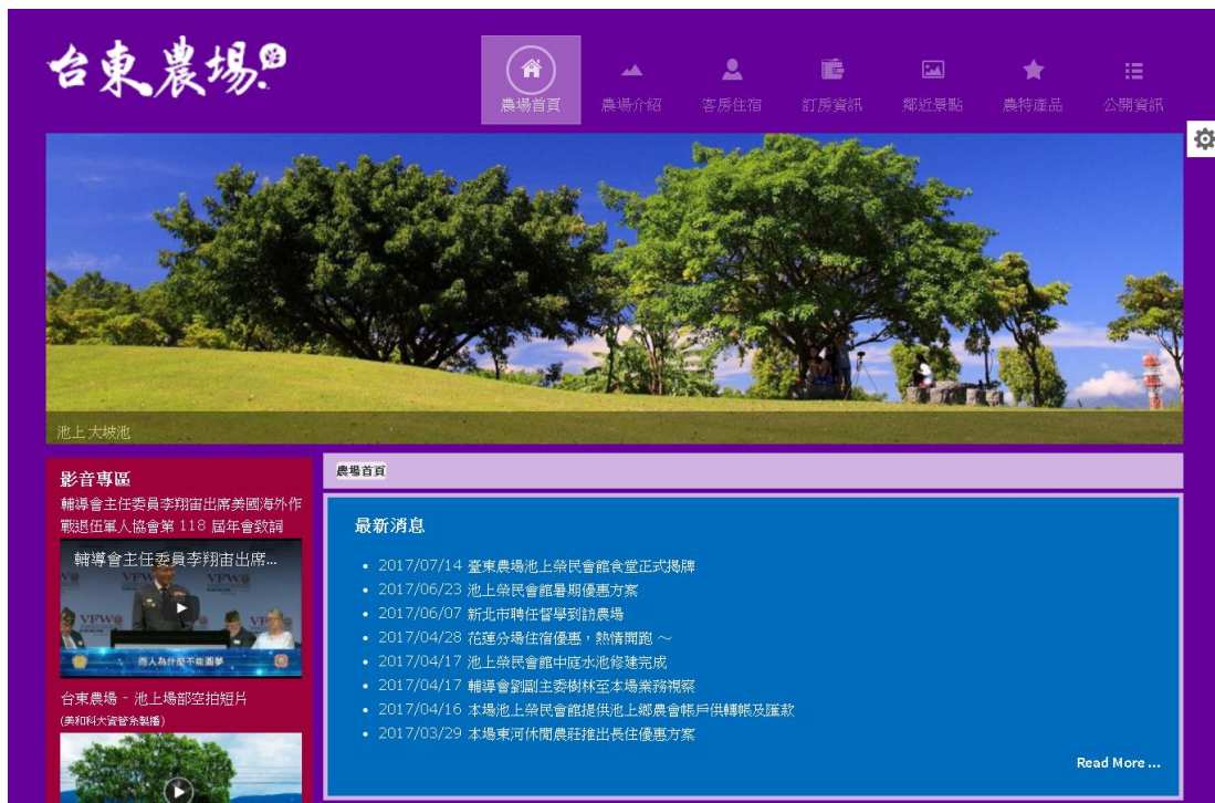
圖 7. 版面背景顏色 - Purple