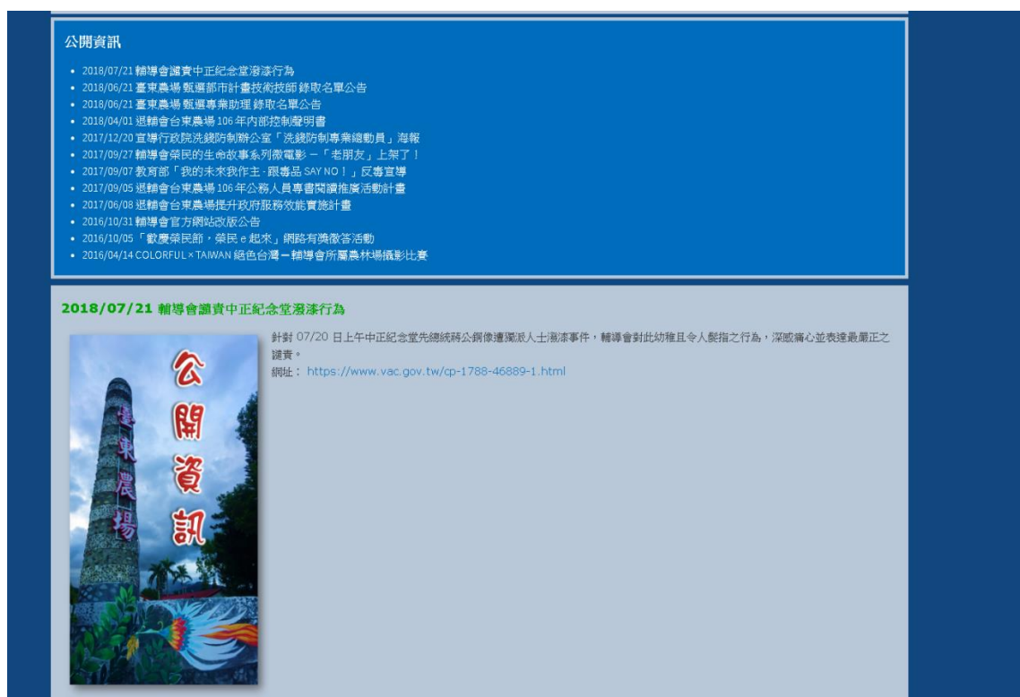
圖 12. 新增公開資訊- 輔導會譴責中正紀念堂潑漆行為

(4) 107/07/21 公開資訊- 輔導會譴責中正紀念堂潑漆行為(如圖 12)。