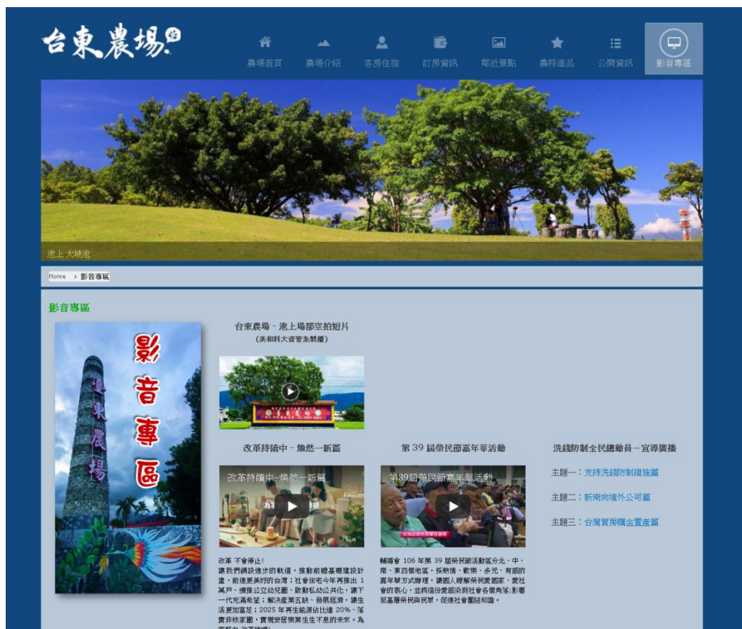
圖 11. 新增影音專區主選單

(4) 107/07/21 公開資訊- 輔導會譴責中正紀念堂潑漆行為(如圖 12)。